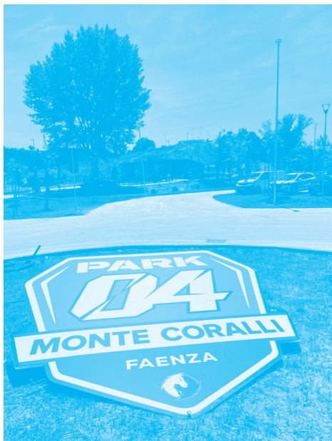
Nuova Grafica Imola

Non vengono accettate iscrizioni il giorno della manifestazione.